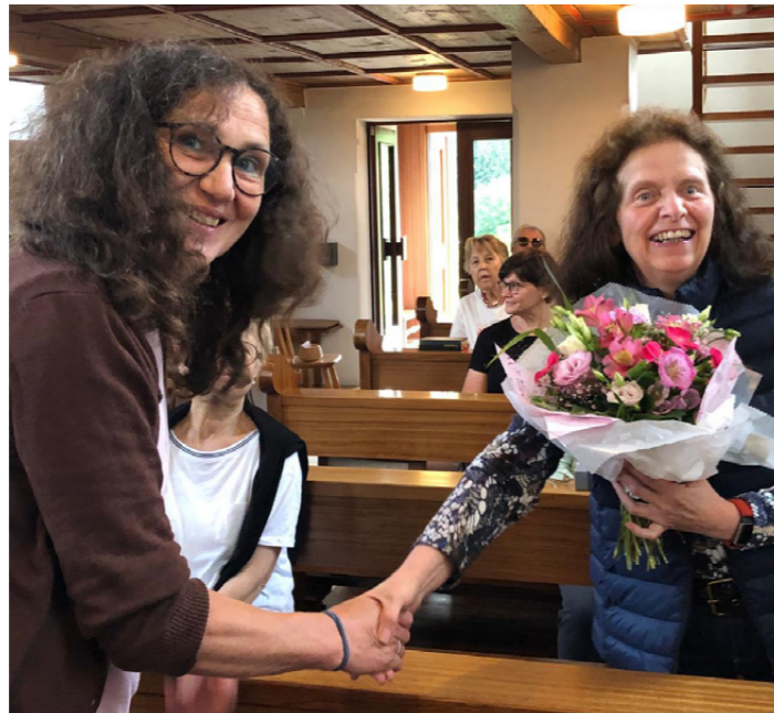
Danke für so viel Einsatz