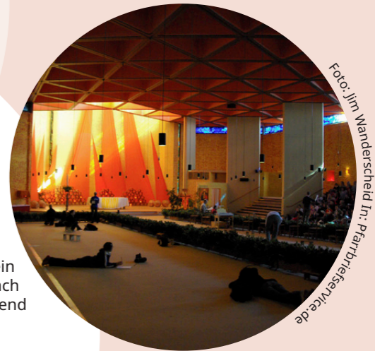
Innenraum der Kirche in Taizé